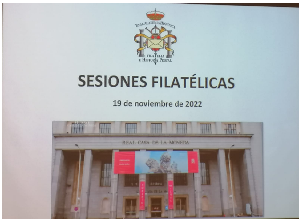
Figura 1 - Locandina dell'evento.

"Best European Philatelic Club" del 2018.